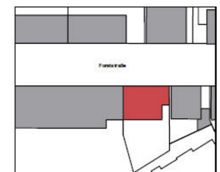
unverbindliche Illustration SW = Sonderwunsch