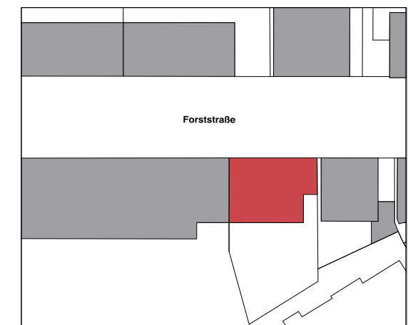
Lageplan M 1.1000