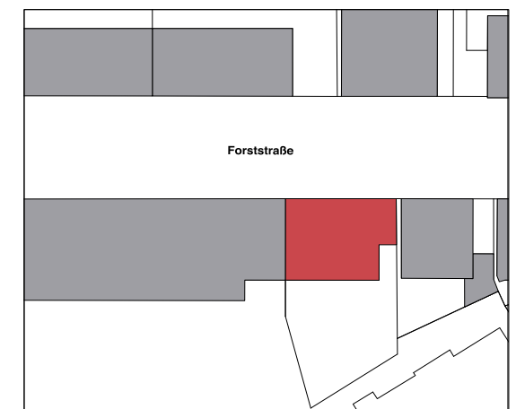
Lageplan M 1.1000