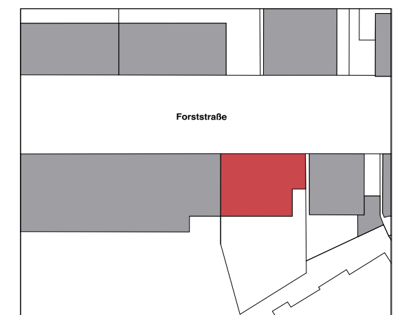
Lageplan M 1.1000