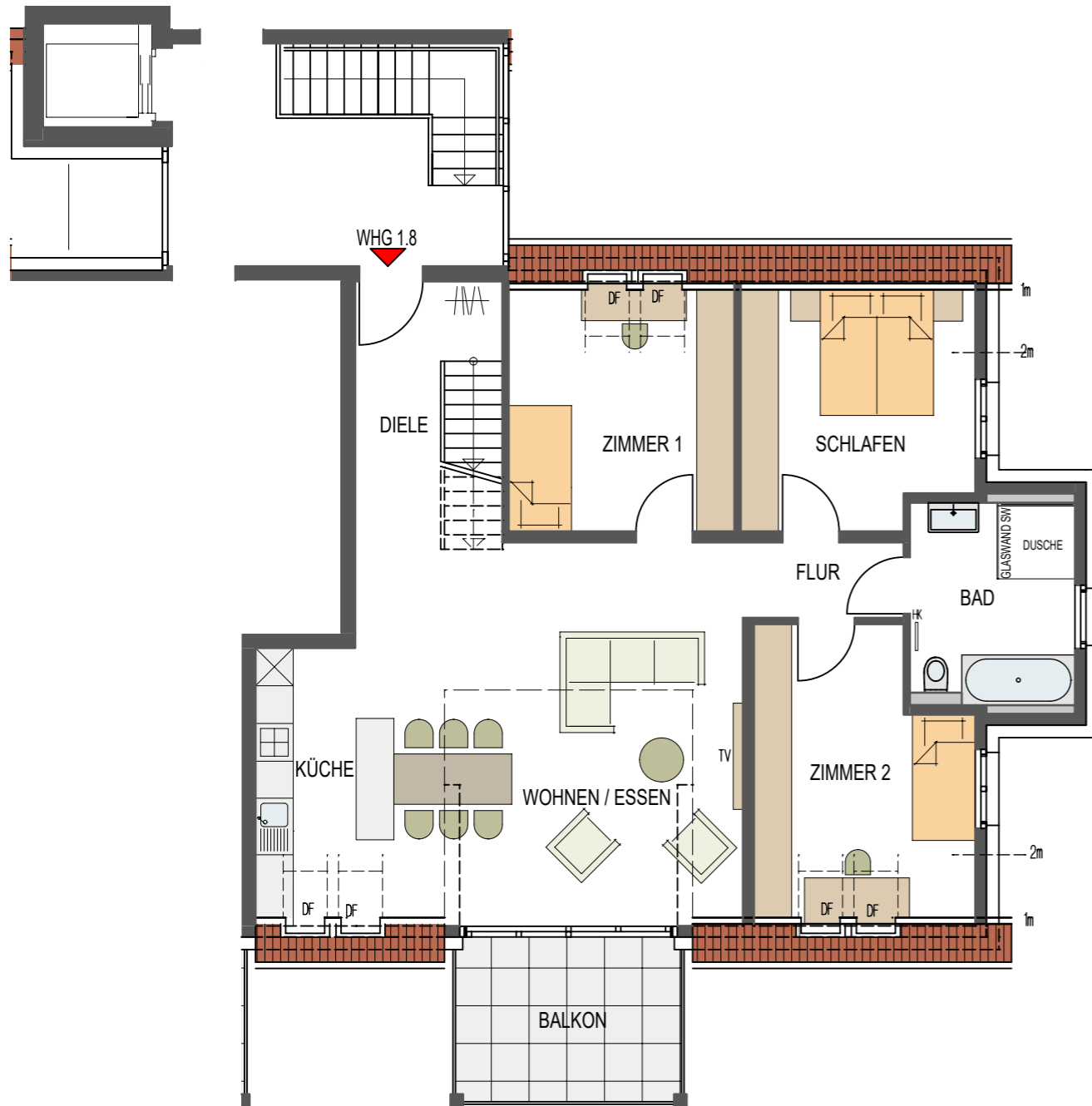
1.DACHGESCHOSS MAßSTAB : 1 - 100