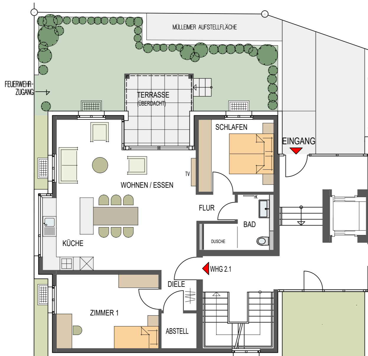
MAßSTAB : 1 - 100