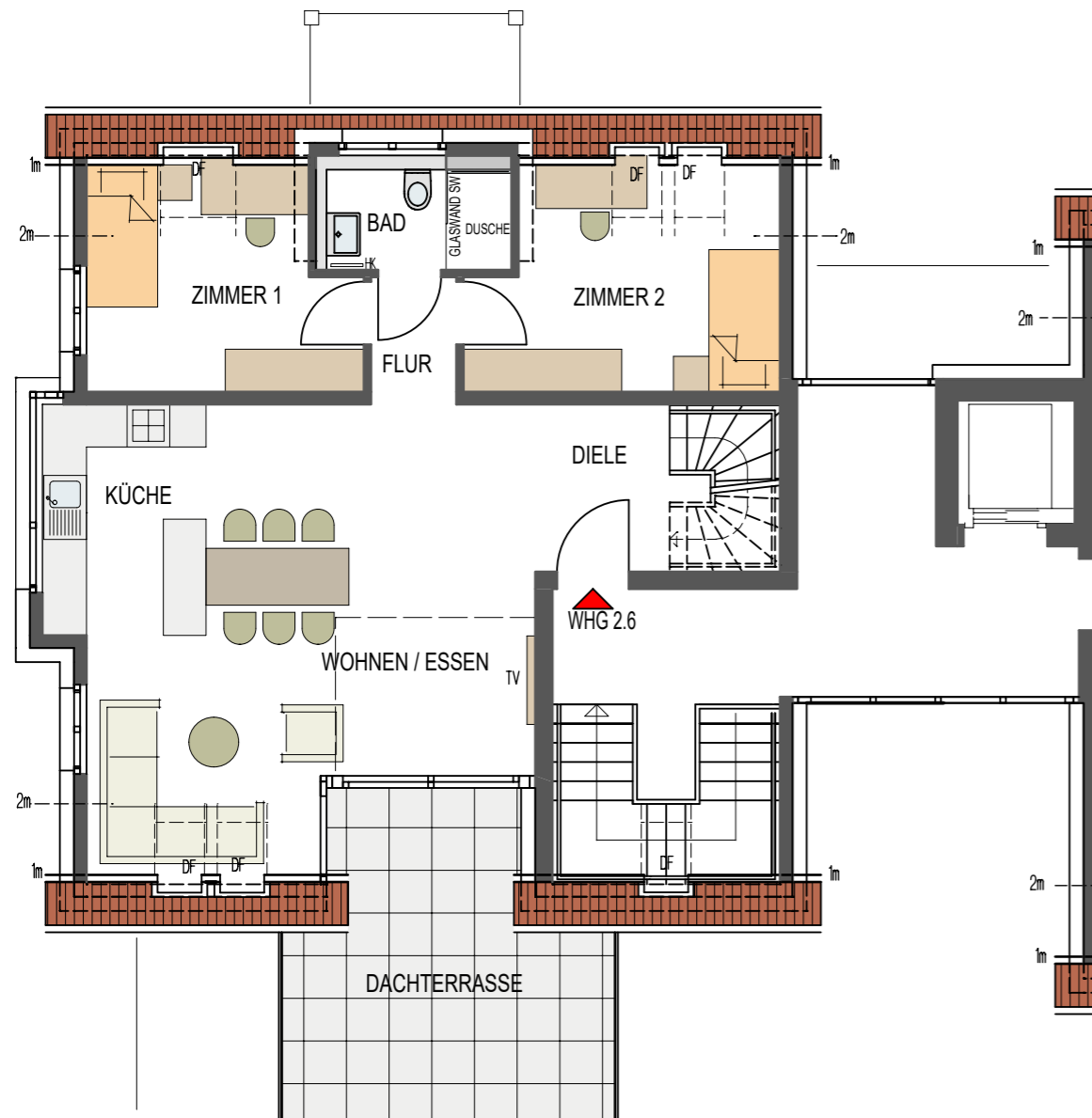
1.DACHGESCHOSS MAßSTAB : 1 - 100