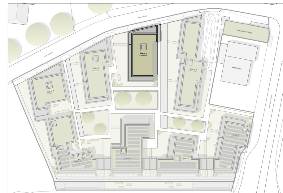
Lageplan Maßstab 1.1000

Neubau Wohnungsbau Sonnenhalde 74172 Neckarsulm